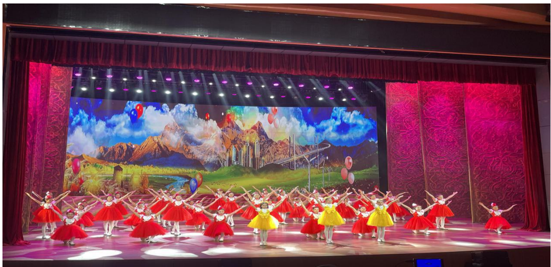
图 24：《向快乐出发》展演

此次主题展演活动由中国文联、新疆维吾尔自治区党委宣传部、新疆生产建设兵团党委宣传部、中国音协主办，旨在深入贯彻习近平新时代中国特色社会主义思想 and 党的二十大精神，用高质量的文艺创作成果增强各族人民实现中华民族伟大复兴的精神力量。