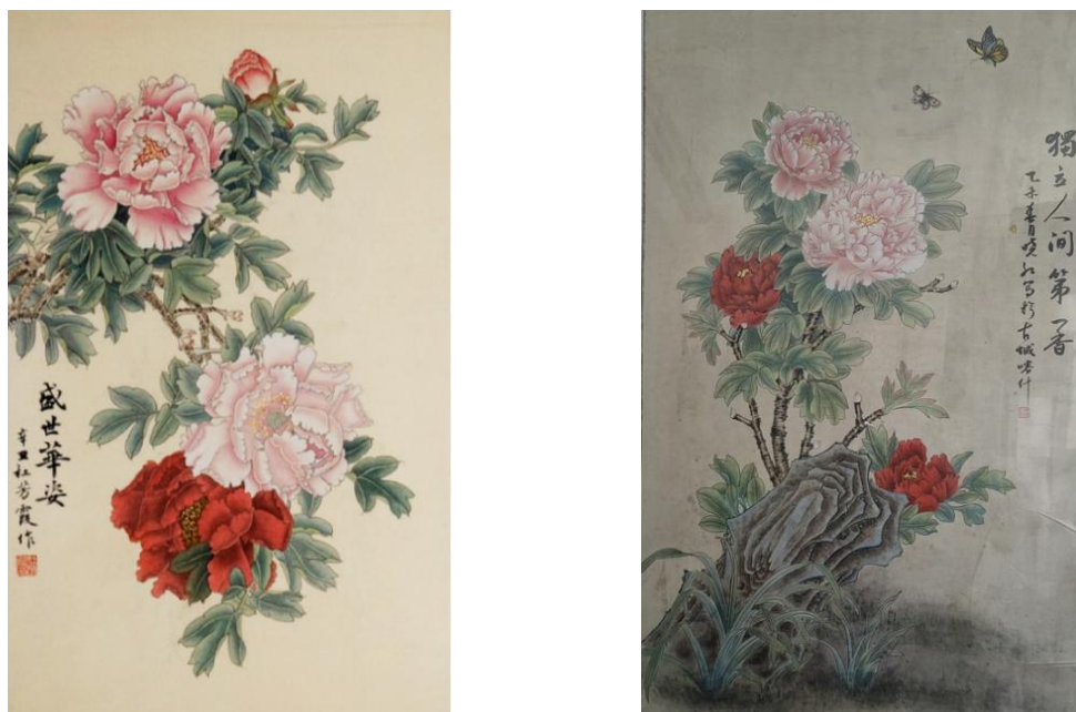
图 27：中国画《盛世华姿》

本次活动既丰富了校园文化生活，又建立了很好的师生交流平台。大家在交流过程中相互借鉴，相互学习，使好的绘画方法技巧得到推广，既增强了学校的艺术氛围，又为学生今后的努力指明了方向。