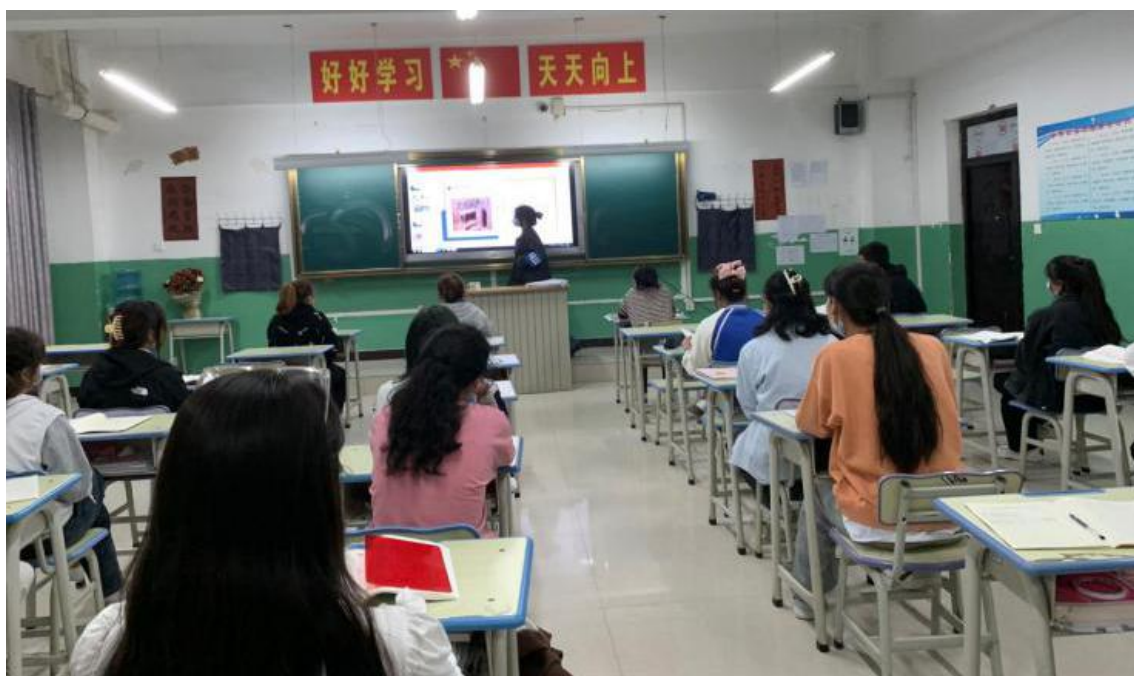
图 5：学雷锋宣讲团开展宣讲

此次宣讲活动的开展加深了同学们对雷锋精神的认识，让学生明白要时刻把“雷锋”带在身上，养成节约等文明行为习惯，形成良好的校园文化风尚。