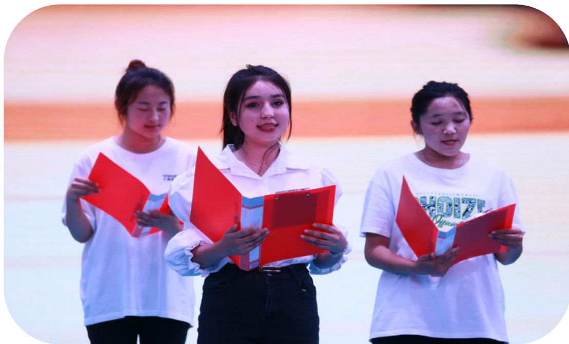
图 38：学生朗诵《诗意中国》

此次活动检验了学生学习国家通用语言的成效，展现了同学们感恩祖国、积极向上的精神面貌，进一步提高了同学们的语言文字规范意识，为传承弘扬中华优秀语言文化奠定坚实基础。