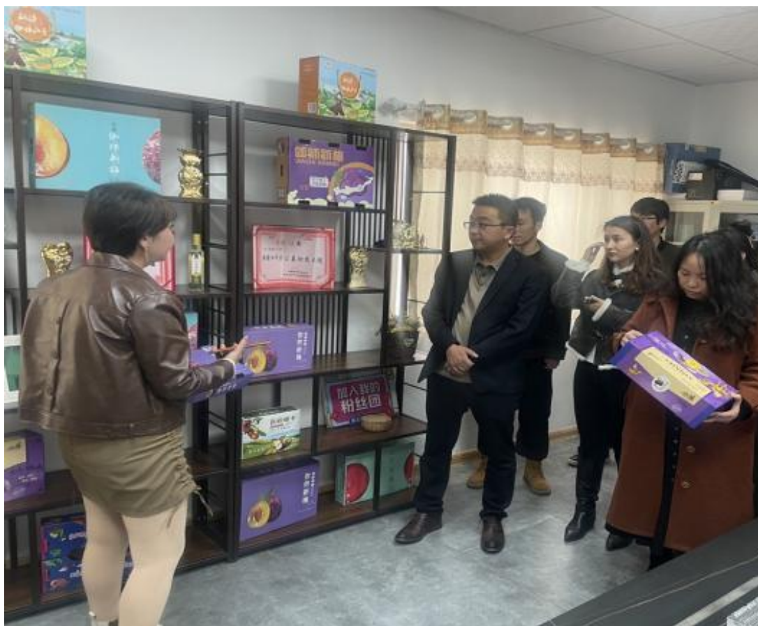
图 50：教师参观特色农产品电商平台

此次活动为校企双方在更广阔的领域协同发展搭建了平台,拓宽毕业生在喀什就业基地的范围,也为提高学生的就业质量,服务于地方经济发展创造了条件,对学院电子商务专业教学改革、就业工作的发展起到积极地推动作用。