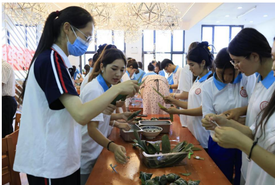
图 32：学生们在包粽子