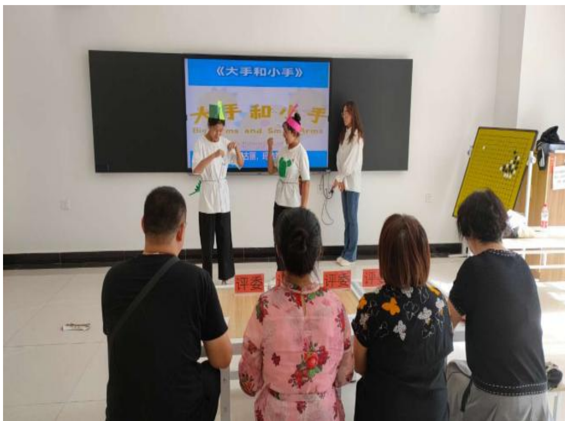
图 41：“小手拉大手”讲故事大赛现场

通过开展推普周活动，成功地营造了“人人说普通话，人人爱中华”的良好氛围。提高了同学们对普通话的认识和应用水平。这次活动既让同学们更加深刻地认识到普通话的重要性，也增强了学生对中华文化的认同感，弘扬了中华优秀传统文化。