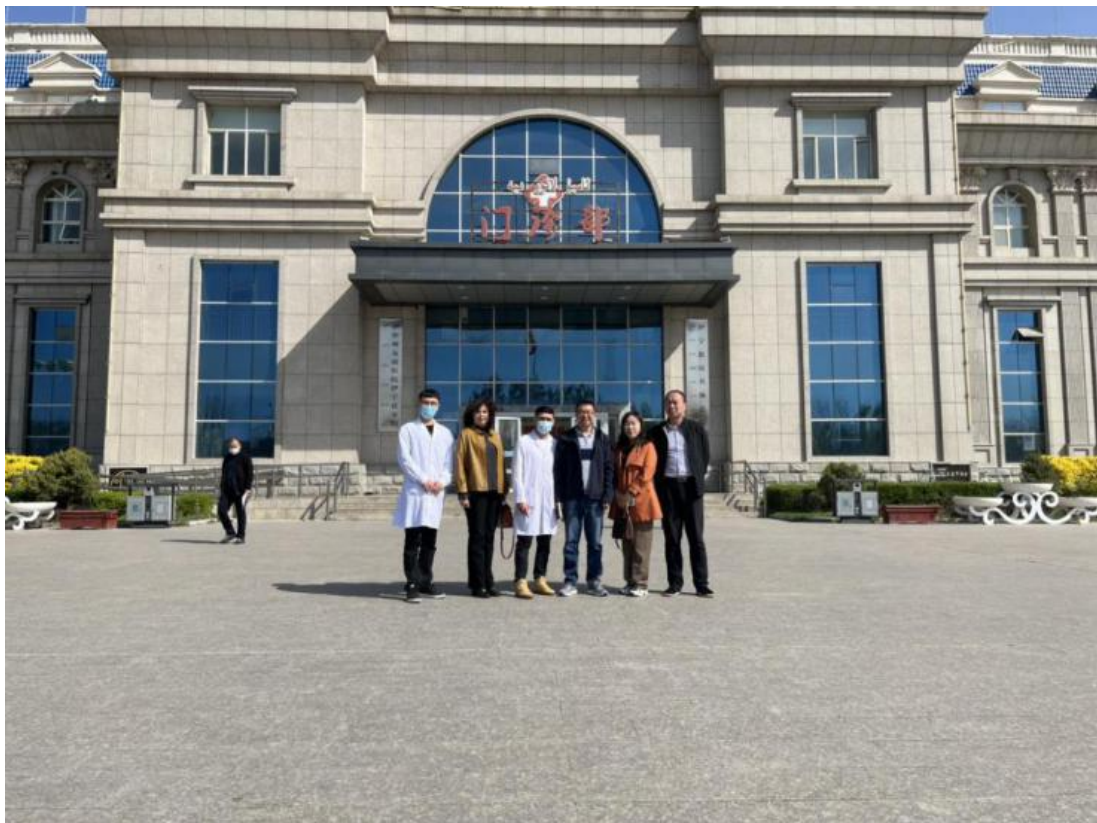
图 7：访企拓岗进行时

本次调研走访，完成首次与北疆多家医疗机构在实习就业等方面的调研走访，对医学系在北疆的招生、实习和就业工作的开展具有里程碑意义。