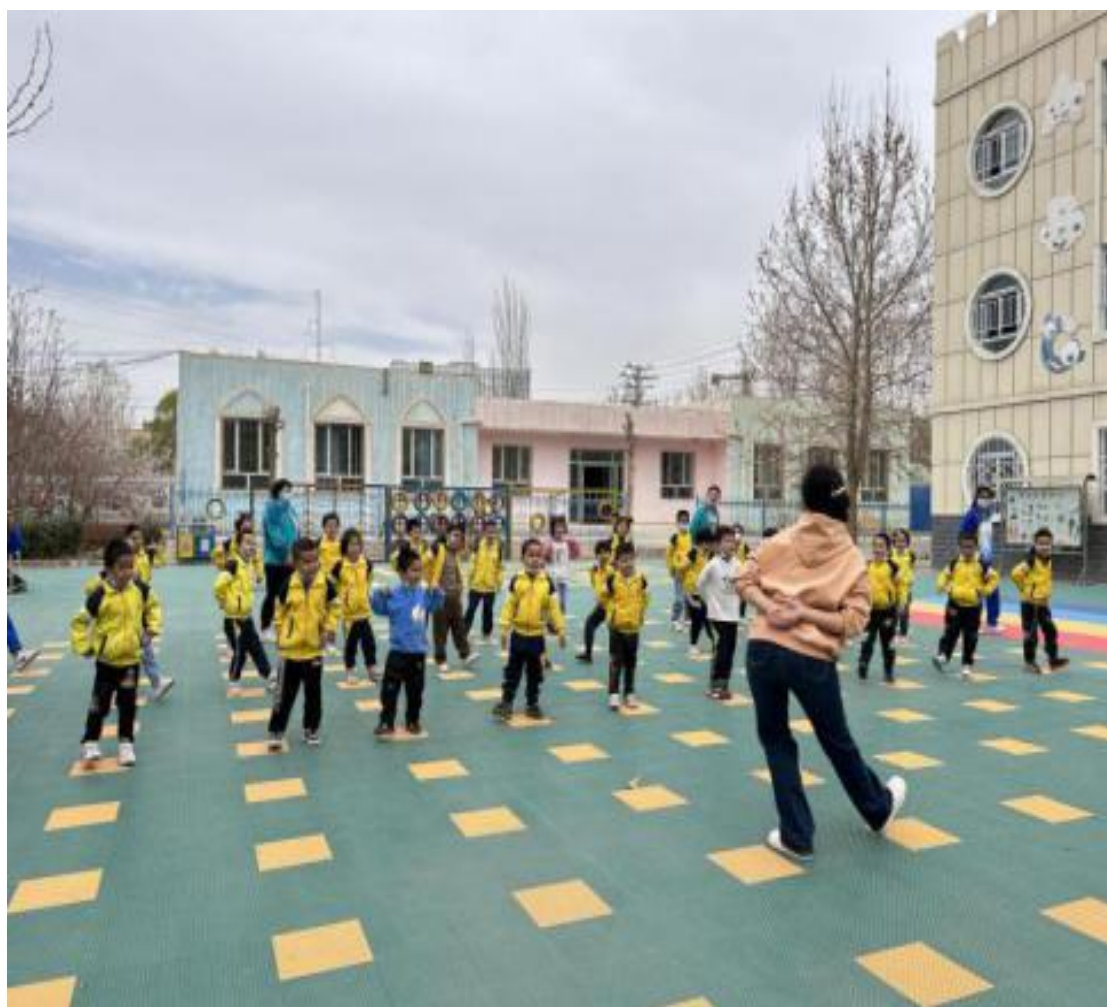
图 16：学前教育专业学生带领幼儿户外活动

3月16日，学前教育专业师生前往喀什市多来提巴格乡中心幼儿园进行实地交流和志愿服务活动。专业师生分小组进行了艺术领域、语言领域和户外活动的组织。通过全体师生的共同努力和幼儿园教师及幼儿的全力配合，我们都收获颇多。通过本次活动感受到了很多在课堂上没有接触到的知识，深深体会到课本理论知识与幼儿园工作实践之间的巨大差异。小老师们还积极表态，要在今后的学习中更加努力学习，积极参与活动，为再一次进幼儿园组织活动做好准备。