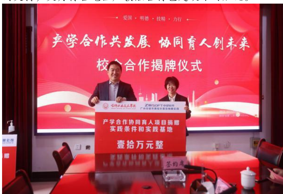
图 49：教师代表接受企业捐赠的软件设备及师资培训项目

此次签约揭牌标志着高校与各企业之间的紧密合作迈向了更加坚定的一步，校企双方达成一个双赢的局面。一方面，为教师提供了企业实践的资源 and 机会，为学生提供了学习和就业的平台；另一方面，为企业的长远发展提供强有力的支持，更为符合地区产教融合特色建设添砖加瓦。