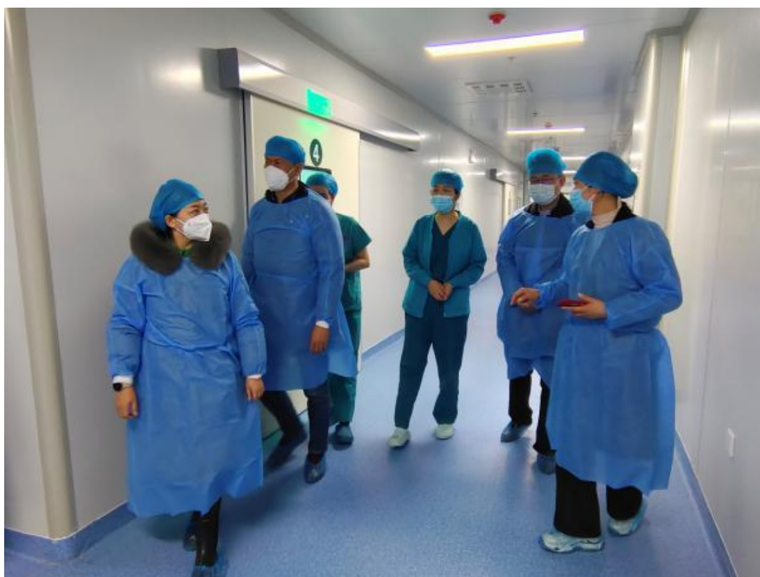
图 47：参观喀什市人民医院

通过本次走访交流，双方进一步达成了合作共建意向，有助于深化学校教育改革、提升教育质量。