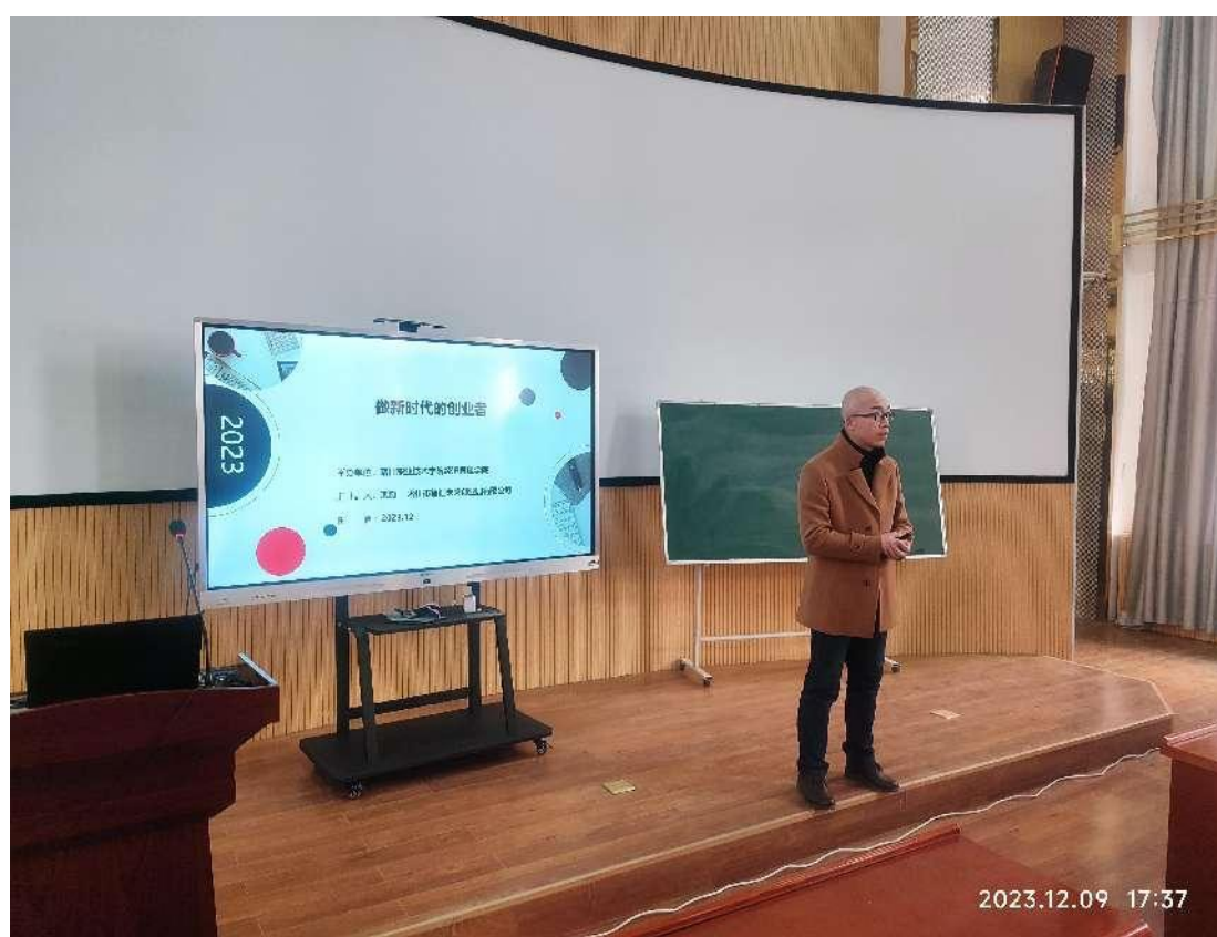
图 11：创业导师举办讲座

学校邀请企业家、创业导师进校园，分享创业经验和心得，融入创业元素，培养学生的创新思维和创业精神，培养学生的独立思考、问题分析和解决问题的能力，引导学生掌握创新创业的基本知识和技能，激发学生的创业梦想，让学生了解创业的重要性，培养他们的创业意识，培养具备创新创业能力的专门人才。