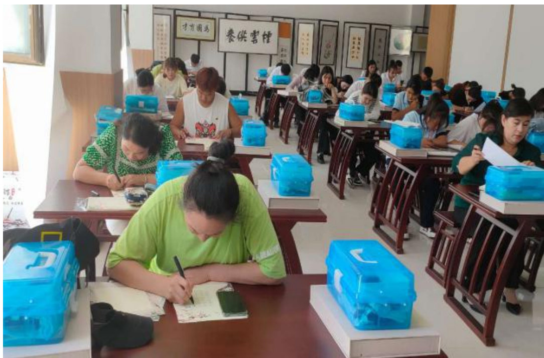
图 39：“我爱我的祖国”书法大赛现场

9月11日下午，书法大赛现场的参赛选手们表现出良好的书写习惯，所写作品笔画流畅，结构匀称，整体美观。起笔下落之间，尽显专注，起承转折之处，满溢真情；他们用心书写着每一个汉字，横竖有情，撇捺传意，字字浅唱低吟书浪漫，笔笔高亢华丽写胸怀！