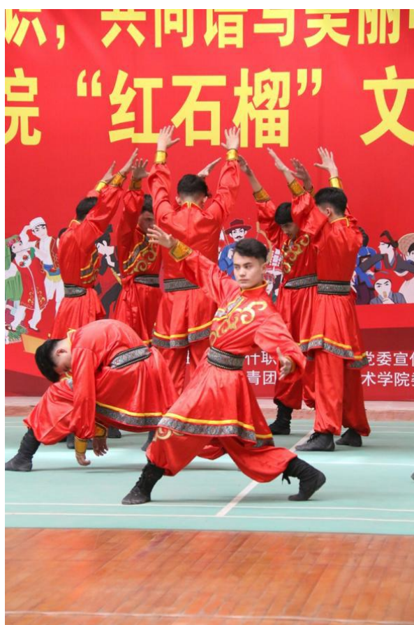
图 33：红石榴文艺展演

钢琴曲、吉他弹唱、手势舞、歌曲独唱、现代舞、大合唱、啦啦操、旗袍秀、民族舞、诗朗诵、专业礼仪等精彩的演出充分展示了当代大学生朝气蓬勃的精神面貌，展示了英姿飒爽的个人风采，参加活动的相关部门领导和工作人员感慨万千：这不仅是一次文艺展演，也是一次民族大团结的盛会，更是一次“民族团结，爱党爱国”的力量展示。