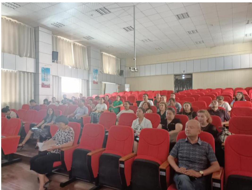
图 54：党员教师观看红色影片《建党伟业》

这是一次深刻的党性教育，更是一次精神洗礼，让全体党员回顾历史、放眼未来，激励前行。此次观影活动，丰富了广大党员的精神文化生活，激发了广大党员热爱党、拥护党的坚定信念。