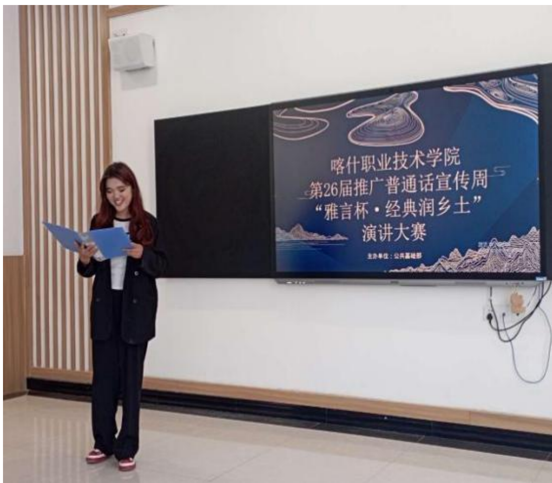
图 40：“家园中国”诵读大赛现场

9月12日下午，诵读大赛现场的参赛选手紧紧围绕活动主题，以独诵、合诵、情境朗诵等形式，通过《中国颂》《月光下的中国》《如果信仰有颜色》《读中国》《少年中国说》等主题鲜明的作品，诵出了我们伟大的中国共产党浴血奋战、领导人民开拓进取的华歌；诵出了我们对伟大祖国日新月异、蒸蒸日上的赞美；诵出了我们青年当自强、吾辈创佳绩的豪情！赛场上，选手们声情并茂、激情澎湃，以饱满的热情歌颂着我们的祖国，抒发着对党深深的热爱，让师生们受到了精神上的洗礼和思想上的升华。