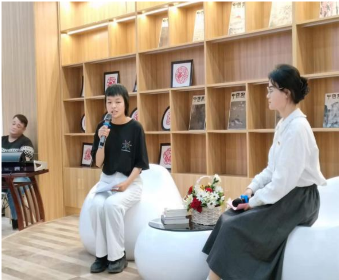
图 25：师生共享读书之乐

第三届“四月读书会”，师生因共同的爱好——读书，走到一起，徜徉于书的海洋，在喧嚣的尘世尽享一隅的静谧，用诗书浸润心灵，让书香溢满校园。