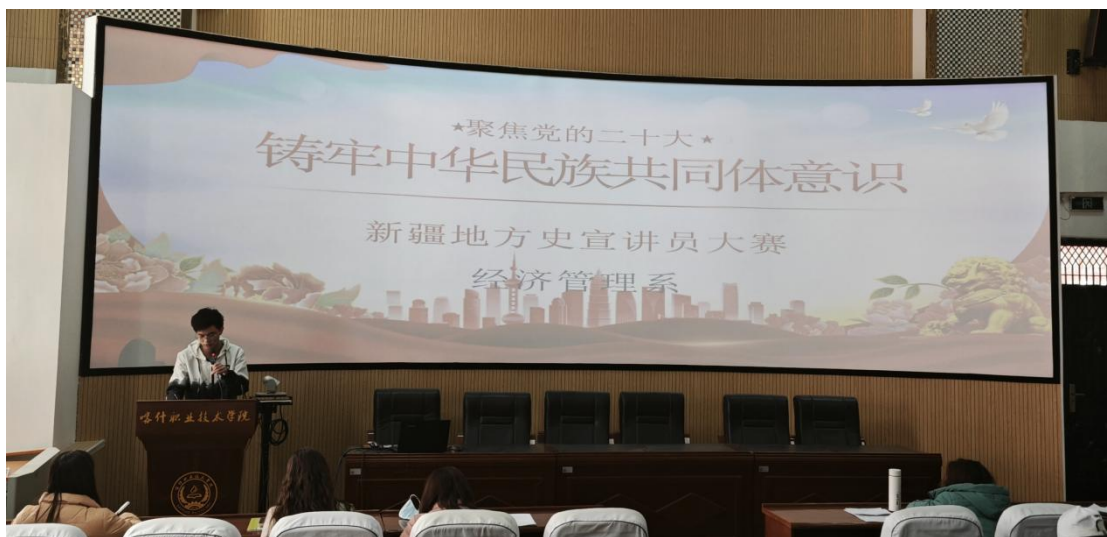
图 37：学生讲述阿尼帕·阿力马洪故事

此次宣讲员大赛，一个个鲜活的事例被搬上舞台，让我们更加深切地认识了新疆，更加深入地了解了新疆的历史。