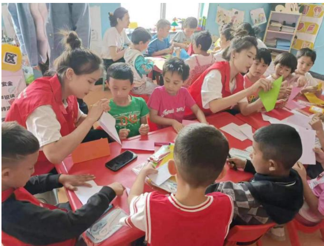
图 20：与幼儿园小朋友进行折纸活动

我院师生与幼儿园小朋友进行了亲切交流，为幼儿园小朋友准备了跳绳、棒棒糖、小背包和折纸等礼物，学生利用所学专业知识和幼儿园小朋友开展幼儿折纸、小蜜蜂儿歌展示、黑走马舞蹈展示等互动活动，优美的旋律、和谐的节奏、真挚的情感给小朋友们以美的享受和情感熏陶，启迪引发他们的思维，又可以增强课堂教学的丰富性，做到快乐学习。