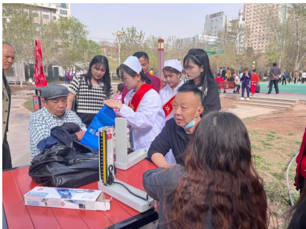
图 19：师生为社区群众义诊

学校深化志愿者文化建设，通过开发志愿服务慕课，培育专业化志愿服务团队，开发志愿服务基地，搭建志愿服务能力提升平台，推动志愿服务转型升级。