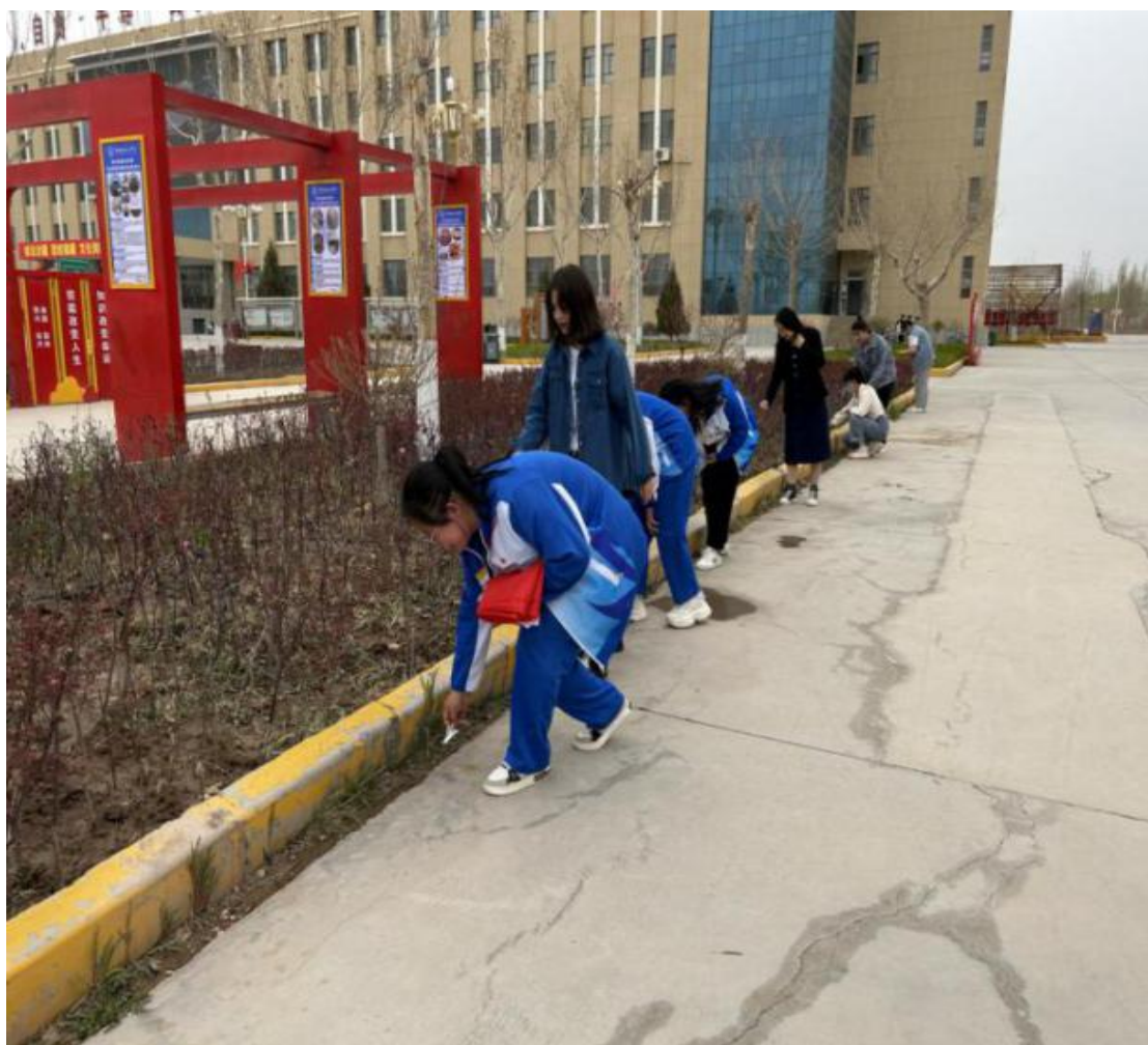
图 6：师生学雷锋美化校园

3月31日，教育艺术系各党支部以党建带团建为契机，联合系团总支共同开展了“弘扬雷锋精神，倡导文明新风”主题党日活动。党员教师、学生入党积极分子与学生团员代表以支部为单位、以饱满的精神状态向体育馆、音乐楼、舞蹈楼、餐厅、宿舍区与1号教学楼周围等服务点位开启本次志愿服务。活动中，志愿者们冒着烈日，手持卫生工具，在道路及两旁的绿化带、树丛等处捡拾烟头、垃圾，清洁环境。其间，遇见了许多学生与老师们，大家相互交流并传播环保理念，宣传志愿服务精神，得到了其他老师同学的一致好评。