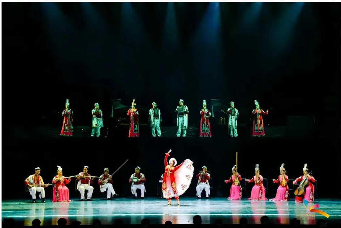
图 29: 《十二木卡姆》演出

此次活动与来自 16 个国家和地区的 100 多个院校、艺术团体、企业及众多专家学者们进行面对面交流,分享彼此的学习心得和经验、近距离欣赏优秀舞蹈作品,从中汲取灵感并丰富自己舞蹈艺术,帮助他们更好地了解舞蹈艺术,并为将来的职业发展定航指向。