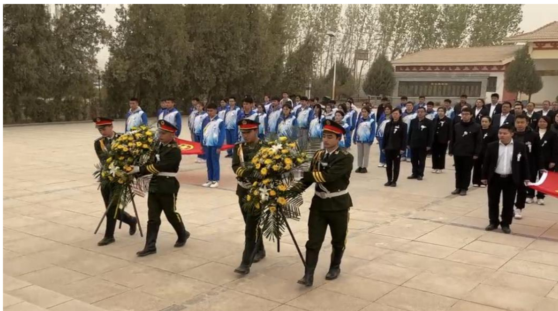
图 55：师生为烈士献花篮

为深入学习贯彻落实党的二十大精神，凝聚精神力量，激发师生们的爱国主义情感，更好地发挥党员、团员的模范带头作用，做好党建带团建工作奠定了坚实的基础。