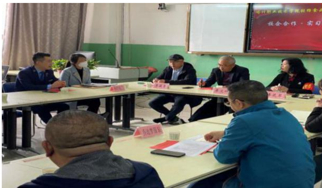
图 4：校企深度合作、实习就业研讨会

研讨会中，系部表示要紧密结合地区产业发展推进校企深度融合；同时深入了解企业人才需求，做好实习就业服务。