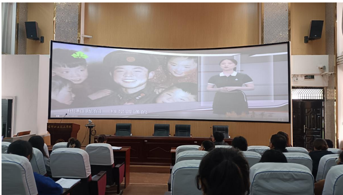
图 53：观看“一颗小小的螺丝钉——雷锋精神”

此次入党动员会，加深了党组织和团组织的联系和交流，紧紧地把他们凝聚在党组织的周围，从思想上激发出他们向雷锋同志学习，争取早日加入党组织。