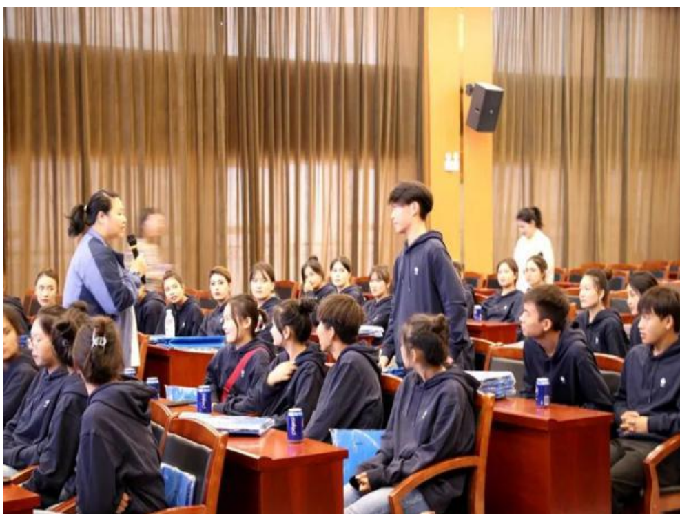
图 57：华住英才班培训

喀职院华住英才班管培生项目，践行了我院校企协同育人，产教融合发展的人才培养理念，校企联动共同为行业培养和输出专业、高素质的技术技能型人才。