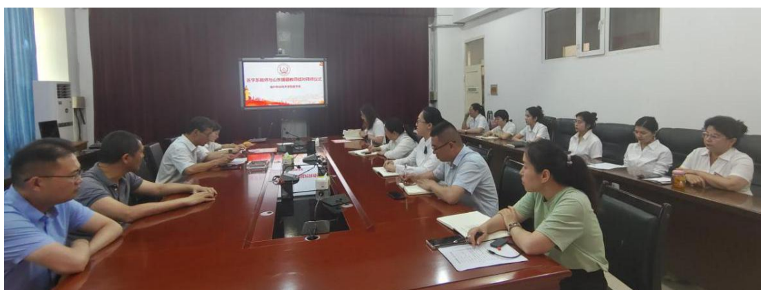
图 59：师徒结对联谊会

这次师徒结对活动的成功举行，将有效促进青年教师的快速成长，进一步壮大学校优秀骨干教师队伍，提升教师队伍的整体素质，为医学系的长远发展奠定坚实的基础。