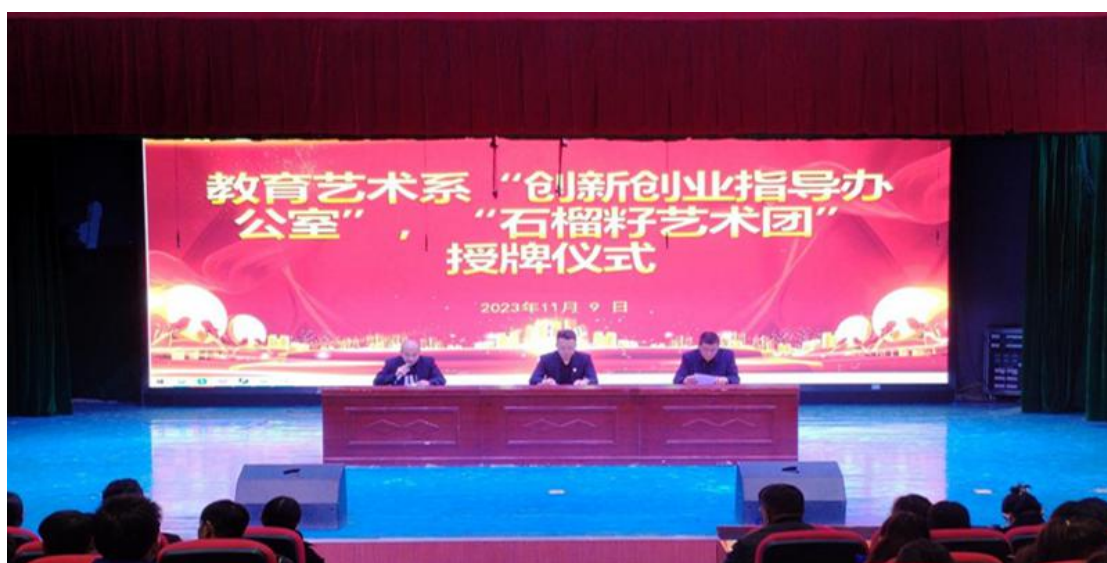
图 15：创新创业指导办公室揭牌仪式

本次授牌仪式本着互惠互利、互相支持的原则，将进一步促进产、学、研相融合，增强师生的实践能力、创新能力，培养双向人才。今后，我院还将继续加大学生创新创业工作力度，将创新创业教育融入整个人才培养过程，不断激发广大师生的活力和创造力，力争在创新创业指导办公室工作中取得更好的成绩。