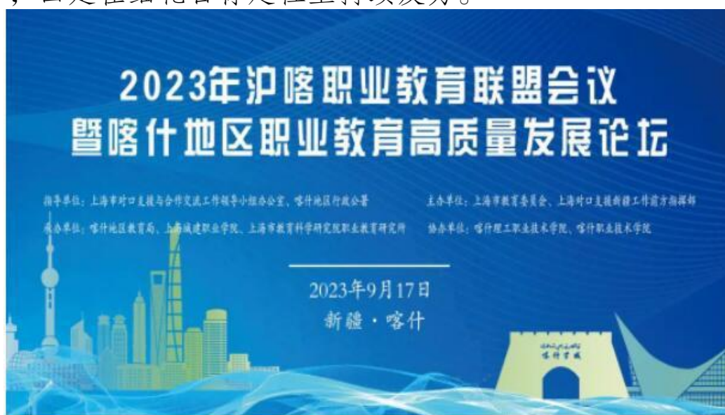
图 58：沪喀职业教育联盟年会

未来三年要不断创新合作模式，在四个方面持续发力：一是在培育地区职教改革内生动力上持续发力，二是在完善地区职业教育体系上持续发力，三是在打造重点院校上持续发力，四是在细化目标定位上持续发力。