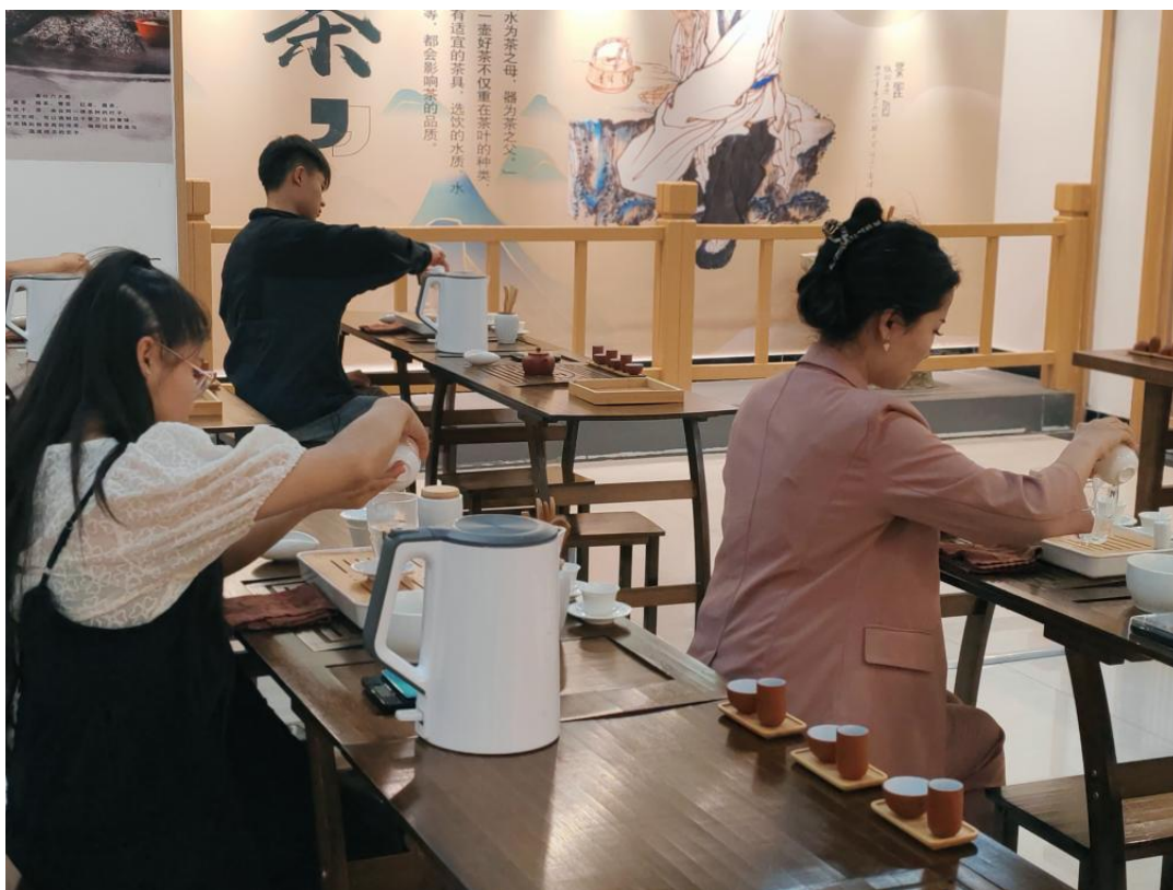
图 36：学生在“国学苑”体验茶艺

本次参观校园文化阵地系列活动，让大家感受到校园文化浓厚的氛围与魅力，让我们周围的校园环境“活起来”，真正发挥校园文化阵地建设的教育意义。