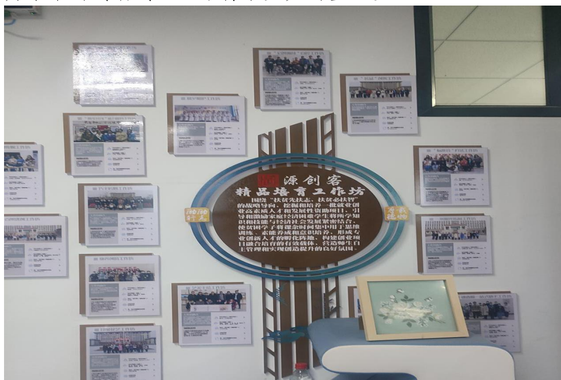
图 14：“源创客”精品培育工作坊

“源创客”创意创业园注重营造浓厚的创新创业氛围，举办各类创新创业活动，如创意市集、创新创业大赛、创业沙龙等，激发学生的创新思维，培养团队协作和沟通能力，为未来的创新创业之路打下坚实的基础。