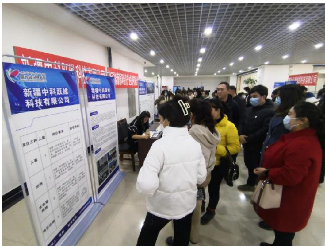
图 9：学生与用人单位进行求职交流

招聘会后,招生就业处鼓励学生积极参加各类培训,在职业生涯规划及专业教学中引导学生考取职业资格证书等技能证书,锻炼学生综合素质,提升毕业生就业率。